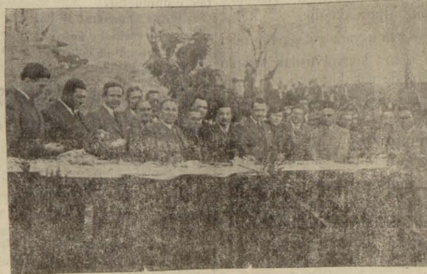
Şehrimizde yapılan küşad resimlerinden bir intiba

İstanbul 27 Radyo - Etilmesudda yeni yapılan Radyo istasyonunda küşad resmi yarın (bu gün) saat onda yapılacaktır. Törene istiklal marşı ile başlanacaktır. Verilecek nutuklardan sonra Riyaseti Cumhur orkestrası tarafından bir konser verilecek bunu müteakip mühendisler delâletile müessese gezilecektir.